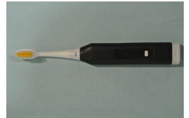
圖 2. 產品圖 (2)